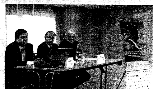
Eiken organiza un encuentro dentro de la Semana de la Calidad

Eiken Basque Audiovisual es una asociación de carácter profesional y sin ánimo de lucro, integrada por las principales empresas vascas dedicadas a la creación y emisión de contenidos, productos y servicios basados en el sector audiovisual. Su objetivo último es impulsar la transformación competitiva del sector. Desde 2004, año de su constitución, las empresas socias de Eiken han desarrollado una serie de acciones innovadoras en el sector enmarcadas en las cinco grandes áreas de su proyecto estratégico: la calidad y mejora de la gestión y formación, las nuevas tecnologías, la internacionalización, los contenidos y las infraestructuras audiovisuales.